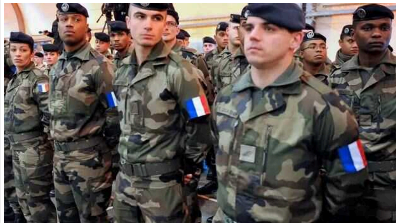
У Франції половина молоді була б готова воювати в Україні для захисту своєї країни, - опитування

Кожен другий серед французької молоді був би готовий піти до армії і воювати на території України, якщо це було потрібно для захисту Франції.