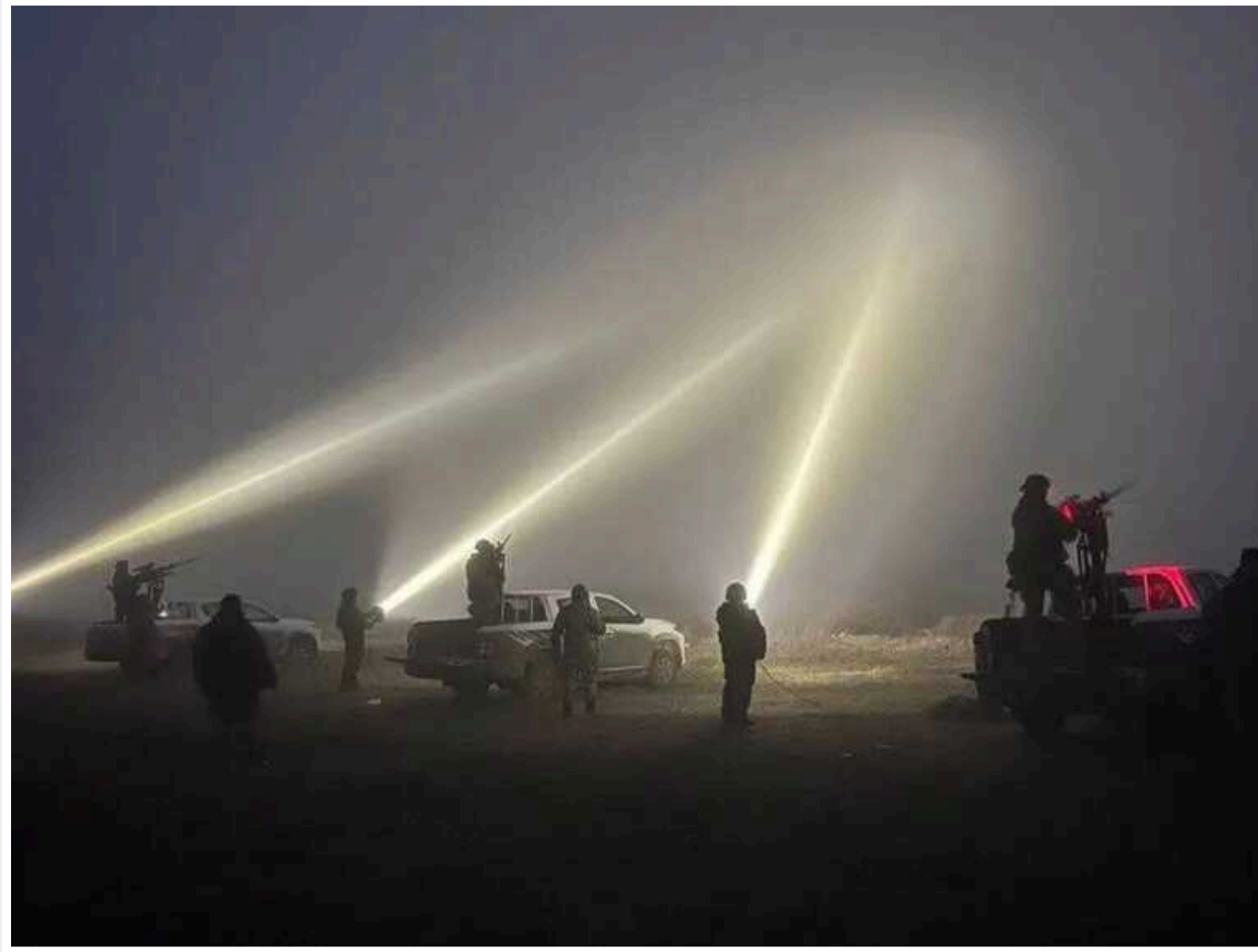
Харків знову атакували «шахедами»: за ніч в області збили 10 дронів

Харків у ніч проти 14 квітня атакували ворожі дрони-камікадзе. На Харківщині за ніч збили 10 "шахедів".