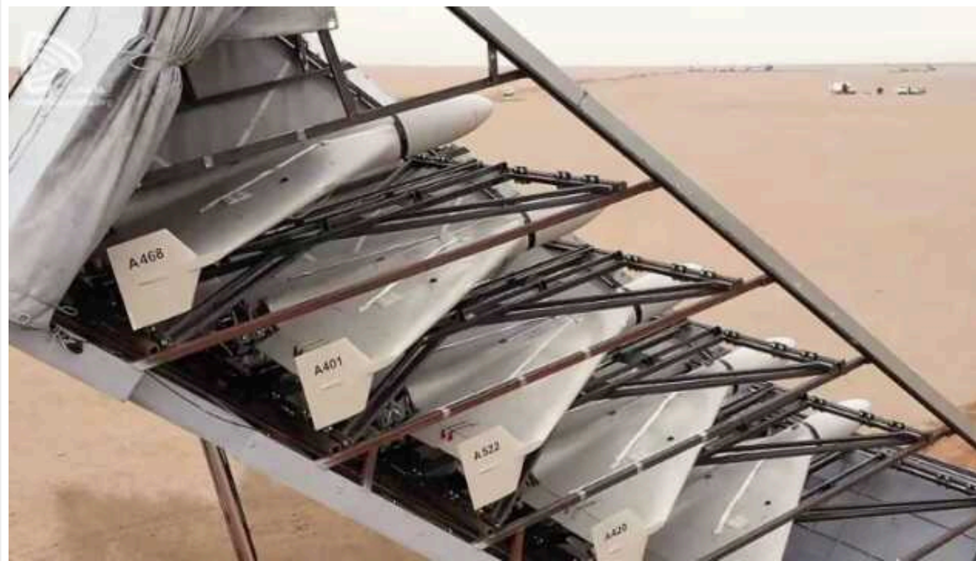
Іранські ЗМІ публікують фото з "роєм" ударних дронів, які летять в бік Ізраїлю

Іранські дрони вже у просторі Іраку, наближаються до Сирії та Йорданії.