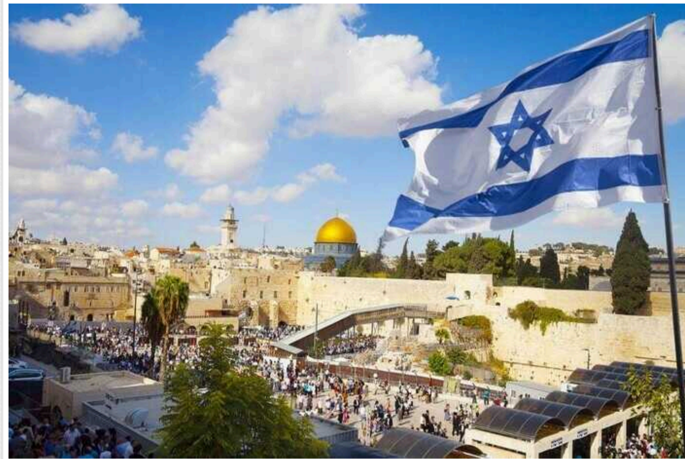
Ізраїль ввів обмеження через загрозу удару Ірану

Ізраїль в очікуванні удару з боку Ірану вводить низку обмежень для забезпечення безпеки населення.