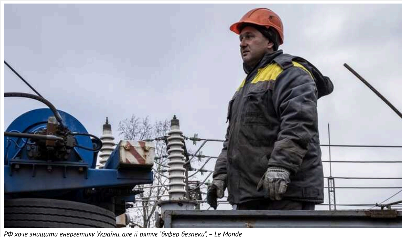
РФ хоче знищити енергетику України, але її рятує "буфер безпеки", – Le Monde

Держава-терористка Росія намагається частинами знищити українську енергетику і наразі досягає у цьому суттєвих успіхів. Від повного занурення у темряву нашу державу рятує "буфер безпеки" – постачання електрики з Європи та розгалужена мережа автономних систем енергозабезпечення.