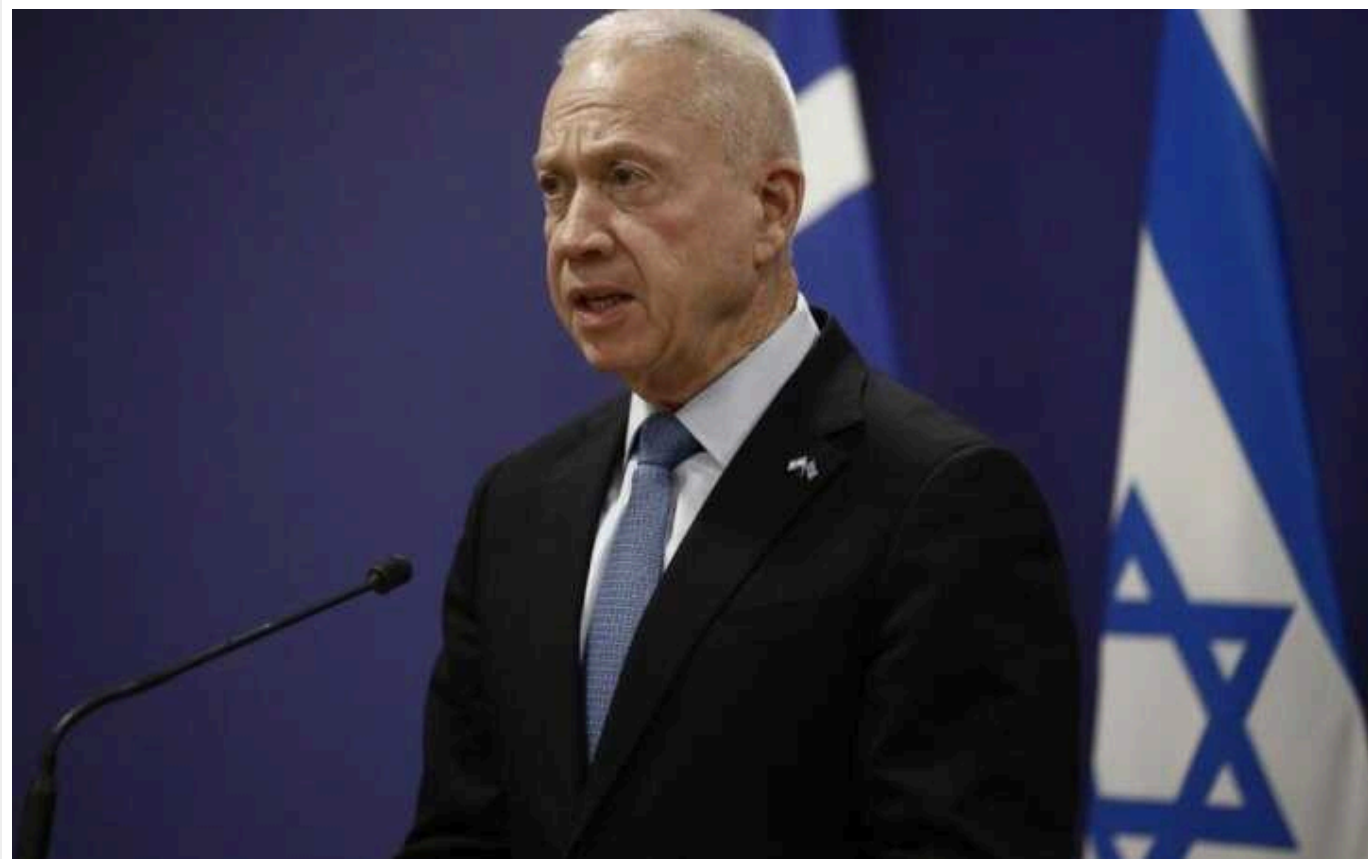
Міністр оборони Ізраїлю Йоав Ґалант зараз проводить екстрену нараду, - ЗМІ

За даними ізраїльських ЗМІ, міністр оборони Ізраїлю Йоав Ґалант зараз проводить екстрену нараду з командним складом Збройних сил.