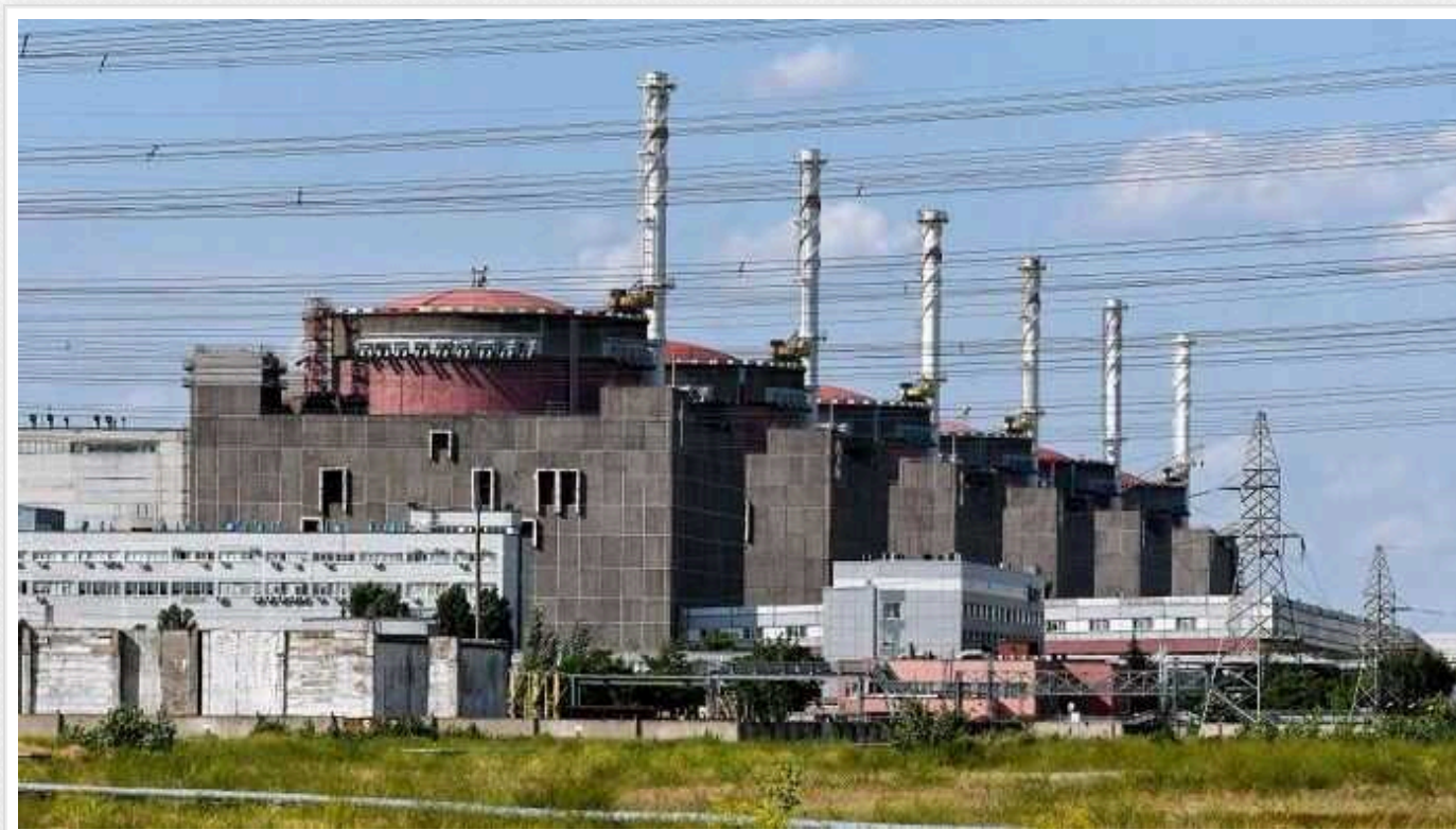
Запорізька АЕС перевела всі реактори в режим "холодного зупину" вперше з квітня 2022 року

Усі шість реакторних блоків Запорізької атомної станції зараз знаходяться у режимі холодного зупину. Четвертий блок ЗАЕС, який був останнім у режимі гарячого зупину, було переведено до холодного режиму 13 квітня, повідомив гендиректор Міжнародного агентства з атомної енергії Рафаель Гроссі.