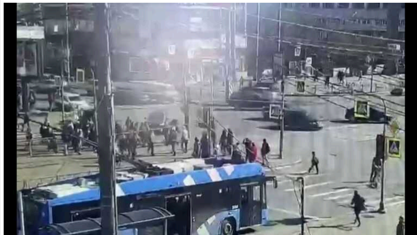
У Санкт-Петербурзі трамвай зі штучним інтелектом врізався у перехожих

Місьцеве управління «Міськелектротранс» уклало контракт з «Уралвагонзаводом» на постачання 22 таких трамваїв У Санкт-Петербурзі трамвай зі штучним інтелектом від найбільшого виробника танків – «Уралвагонзаводу» врізався в натовп пішоходів на вулиці Налична.