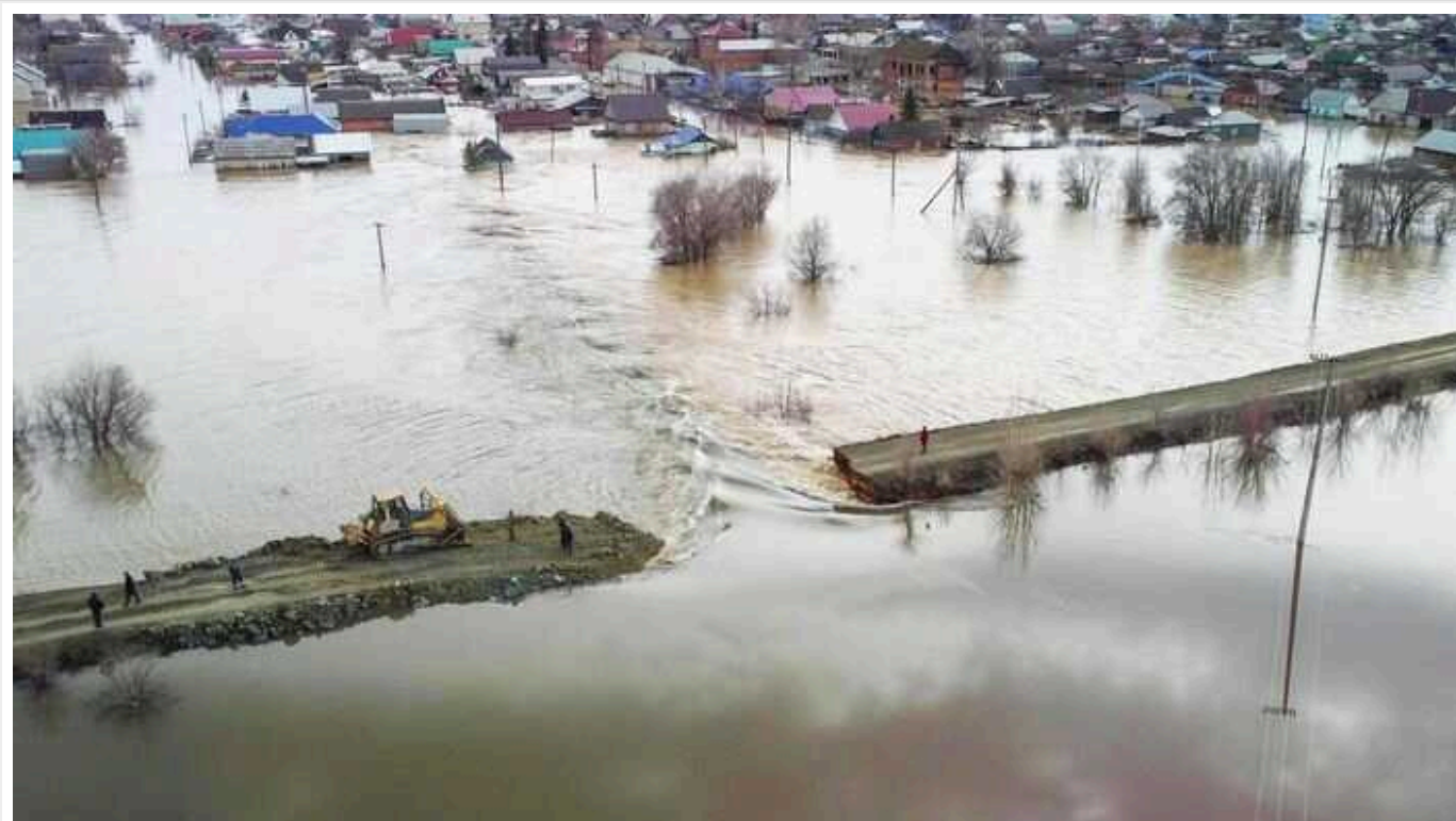
Ор(к)ськ і "руській мір", який смертельний навіть для своїх

Так уже історично складається – і ще деякий час складатиметься в найближчому майбутньому, – що українці так чи інакше стежать за російським порядком денним. Звісно, передусім це цікавість до військово-політичної складової – живий там Путін чи вже помер, які настрої у пропагандистів, чи не почали на федеральних каналах говорити про необхідність припинення «спеціальної військової операції».