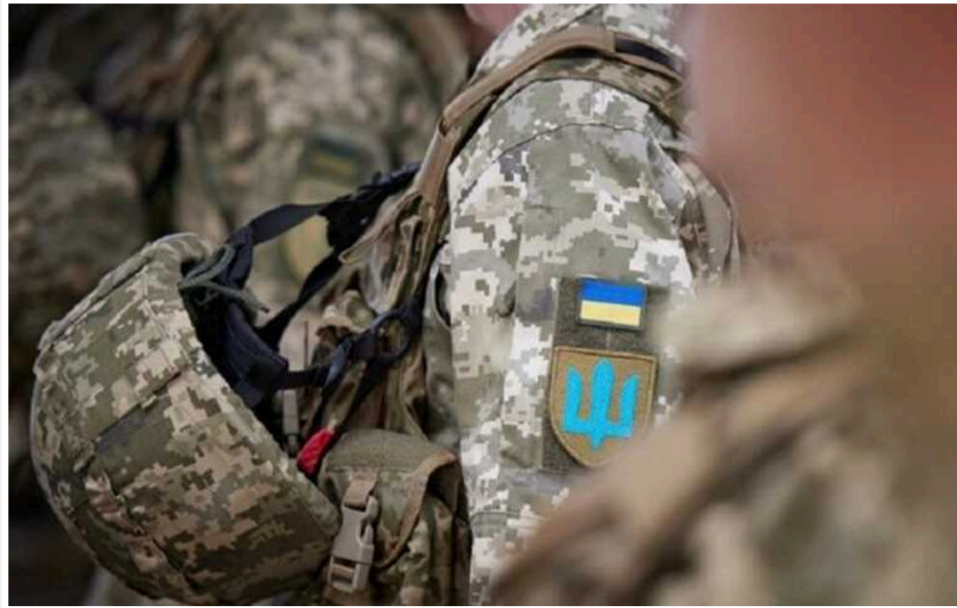
Україна відмовляється від «дембеля» у законі про мобілізацію через побоювання втратити допомогу Заходу

Рада викреслила "дембель" із законопроекту про мобілізацію, побоюючись, що ухвалення норми про демобілізацію військових через 36 місяців викличе скорочення допомоги Заходу.