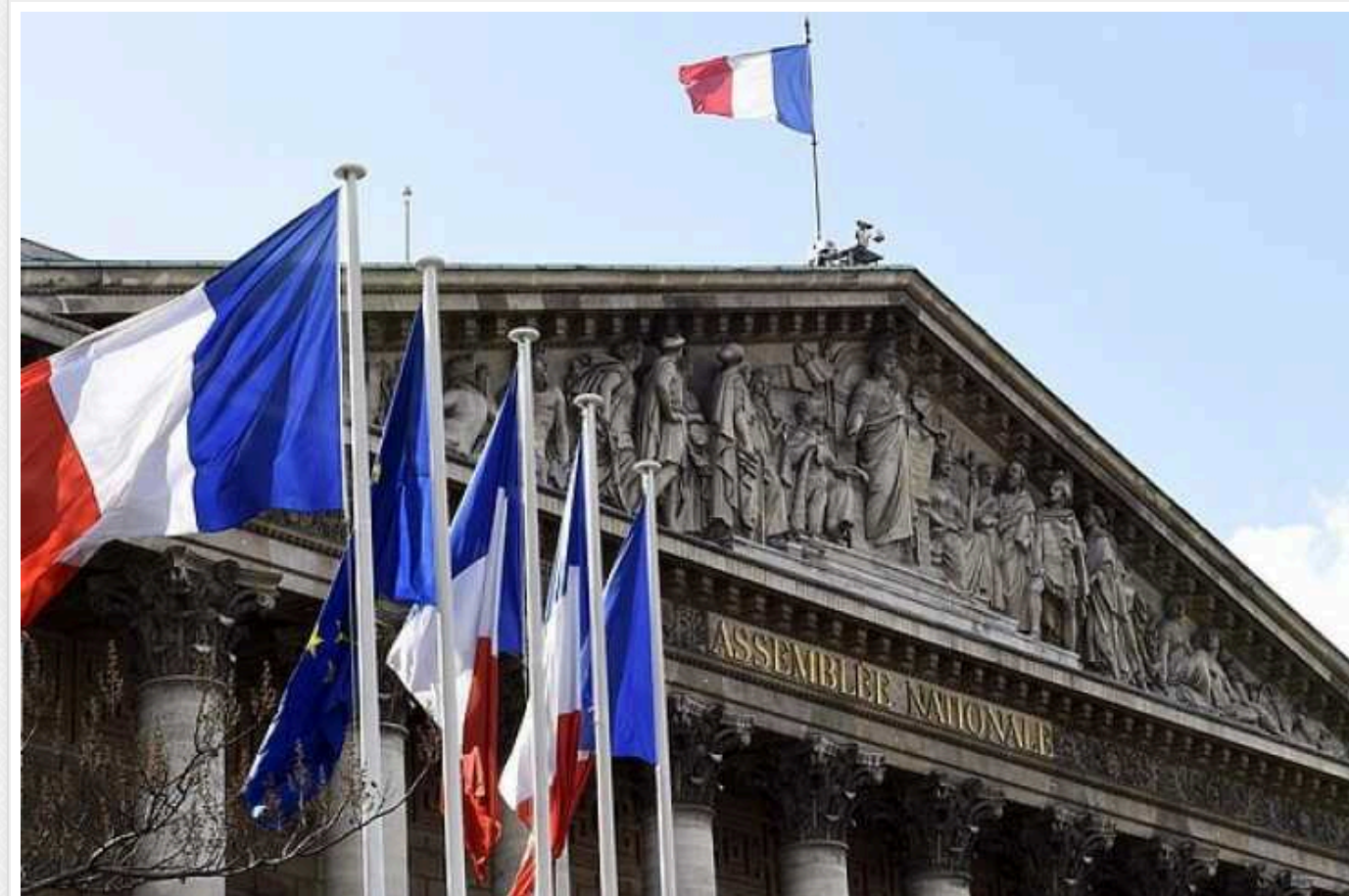
У МЗС Франції рекомендували своїм громадянам утриматися від поїздок до Ізраїлю, Лівану та Ірану

Нагадаємо, останніми днями говорять про удар відплати з боку Ірану по Ізраїлю за атаку по консульству в Дамаску.