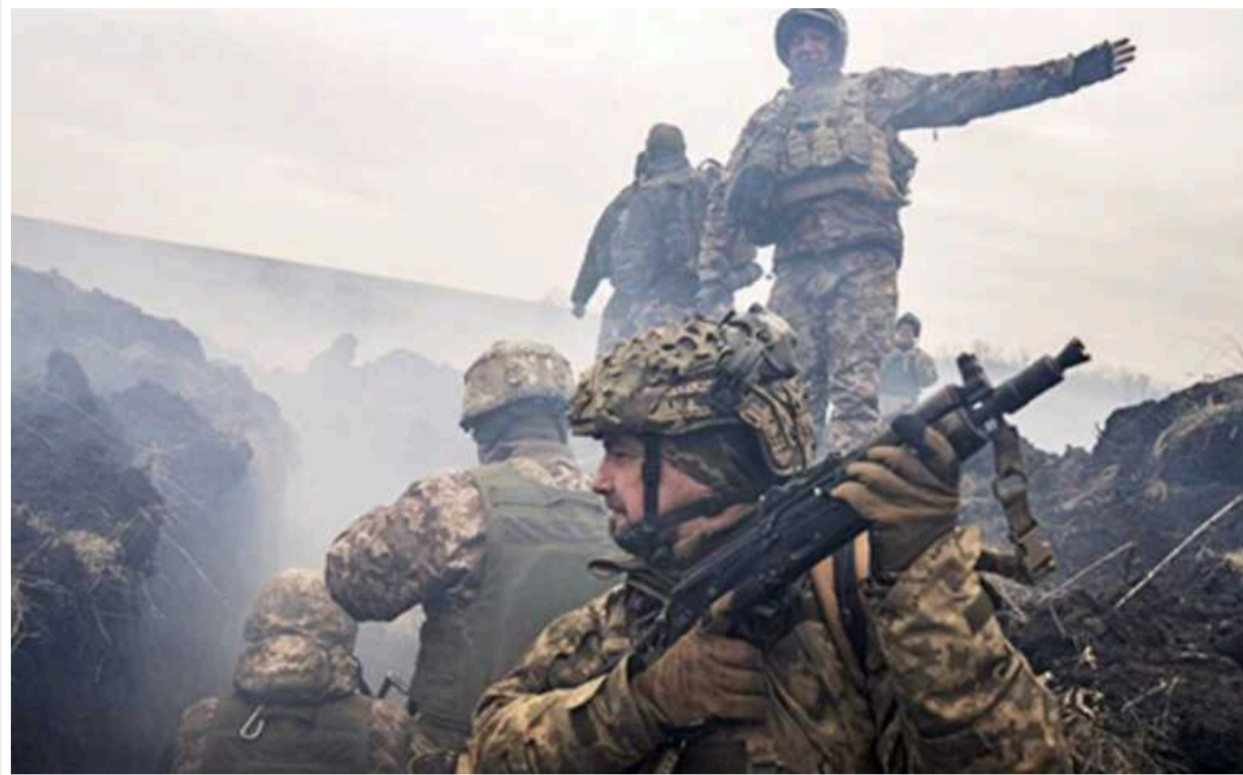
ISW: Ворог просунувся на Херсонщині, а через нестачу ППО у ЗСУ можуть захопити Часів Яр

Російські війська нещодавно просунулися поблизу українського плацдарму на східному (лівому) березі Херсонської області та на островах на річці Дніпро.