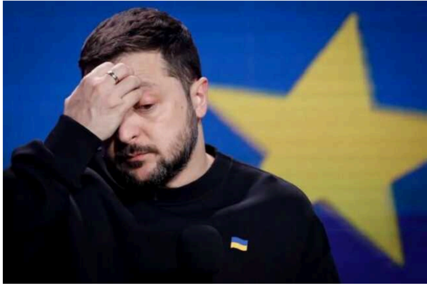
Зеленський зробив заяву про ухилинтів від мобілізації

Відповідно до запиту військових було запроваджено зміни до мобілізації в Україні. У тому числі це стосується і посилення покарання щодо ухилистів.