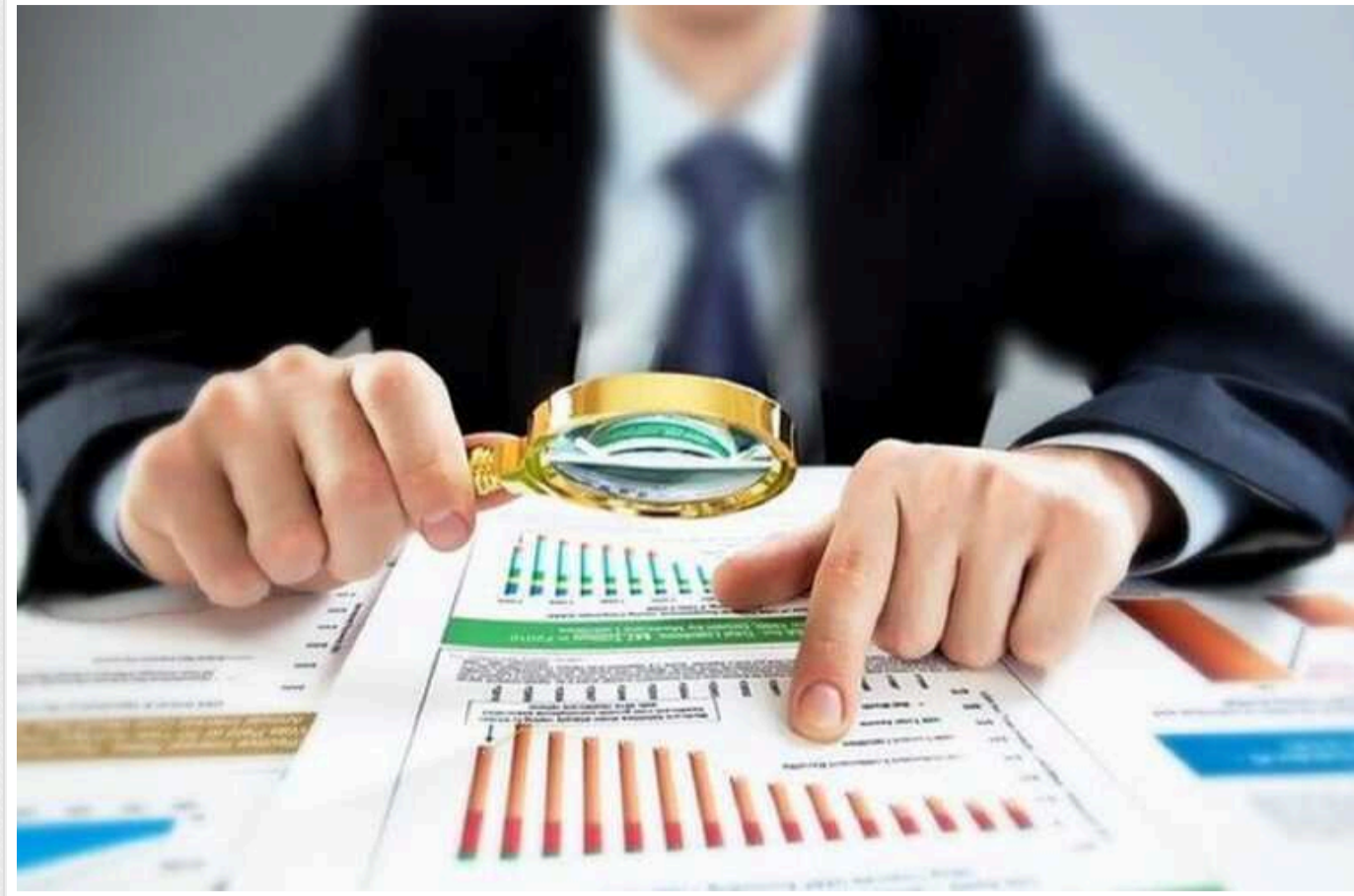
Нацбанк вимагає у банків звіт щодо карткових переказів українців, - ЗМІ

Національний банк України 11 квітня вимагав в українських банків інформацію щодо аномальних платежів, у тому числі і фізосіб. Запит міститься у внутрішньому листі НБУ №24-0006/28104, який опинився у розпорядженні ЗМІ.