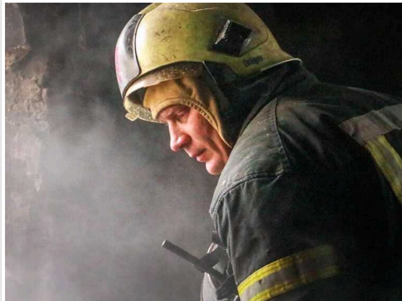
У Костянтинівці через авіаудар окупантів є загиблі та поранені: поліція показала відео

Російські загарбники завдали авіаудару по Костянтинівці Донецької області, застосувавши для атаки керовану авіаційну бомбу КАБ-500. Унаслідок ворожого обстрілу загинули три людини, ще двоє були поранені.