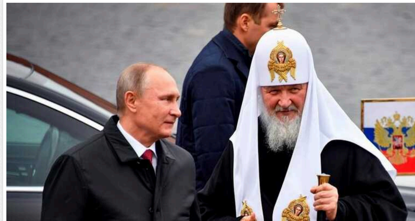
РПЦ оголосила Україні «священну війну», намагаючись виправдати злочини РФ, - Atlantic Council