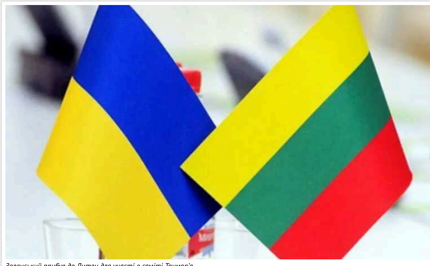
Зеленський прибув до Литви для участі в саміті Тримор'я

У четвер, 11 квітня, президент Володимир Зеленський прибув до Литви. Головна тема запланованих перемовин – зміцнення української ППО, забезпечення нагальних потреб Сил оборони України, а також консолідація міжнародної підтримки нашої держави.