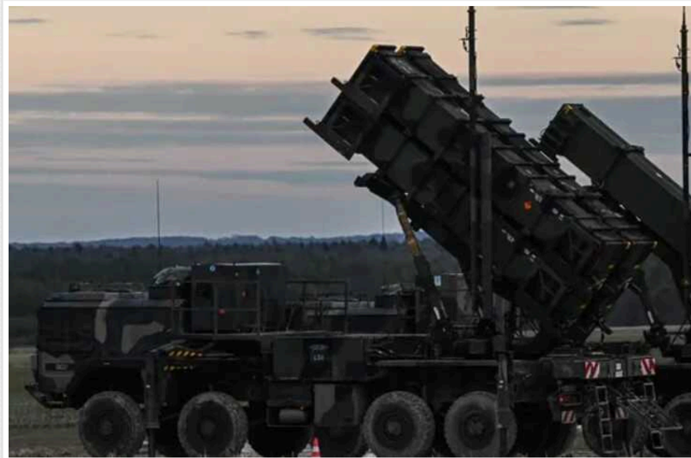
ISW: Україні загрожують великі проблеми у разі ослаблення ППО

Безперервний російський ракетний терор змушує Україну перерозподілити і без того мізерні засоби протиповітряної оборони. У разі продовження масованих обстрілів України, найімовірніше, не вистачить запасів ракет ППО, необхідних для захисту міст та критично важливої інфраструктури.