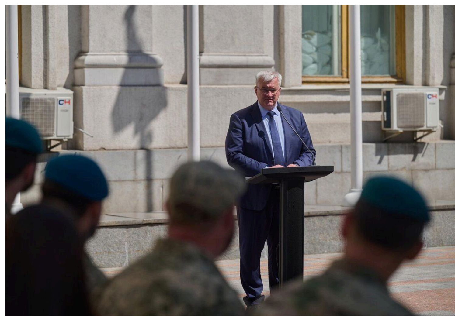
Сибіга вважає, що Росія намагається залякати Україну

Очільник МЗС України написав, що Україна закликає партнерів до рішучих багатосторонніх дій, спрямованих на стримування Росії.