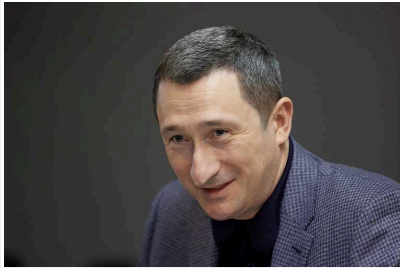
Голова правління «Нафтогазу» Чернишов за минулий рік отримав 21,4 мільйона гривень зарплати, - декларація

Голова правління Національної акціонерної компанії "Нафтогаз України" Олексій Чернишов задекларував 21,372 млн гривень заробітної плати у 2023 році (1,781 млн гривень на місяць).