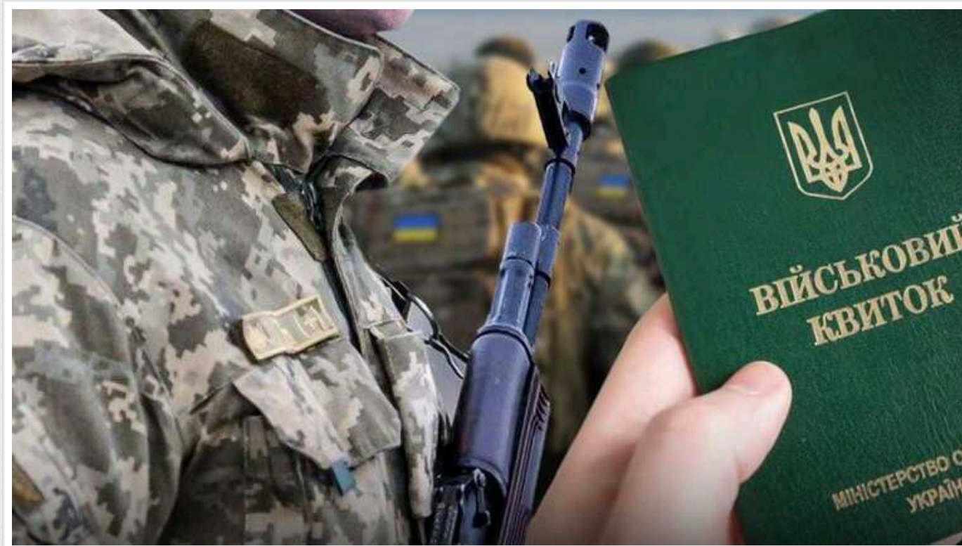
Працівники "Філіп Морріс" і "Тедіс" заброньовані від мобілізації

Тютюнові підприємства, які сплачують податки в Росії, виявилися «критично важливими» для оборони України.