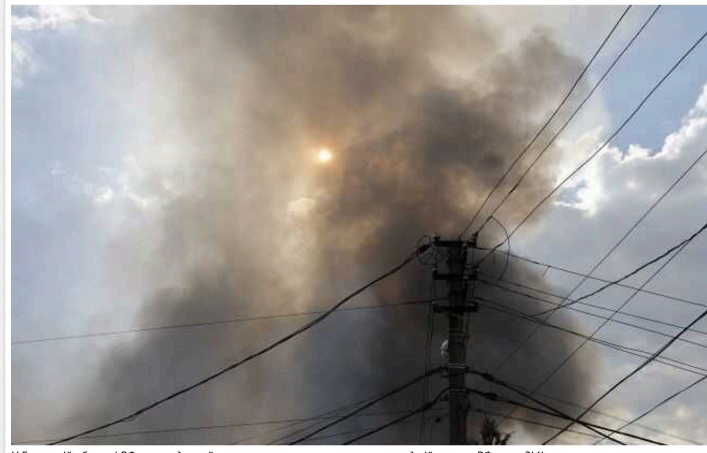
У Брянській області РФ прикордонний пункт зазнав атаки: є втрати серед військових РФ, – росЗМІ

За даними журналістів, унаслідок обстрілу пункту пропуску "Троебортное" загинув російський військовослужбовець, ще троє госпіталізовані з пораненнями.