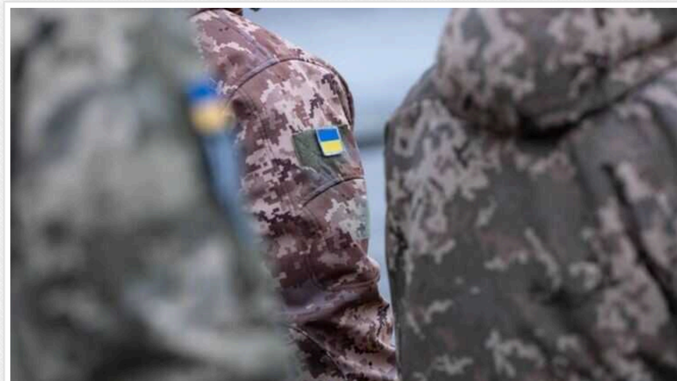
Повістка буде вважатися врученою, навіть якщо громадянин не перебуває за адресою, зазначеною в ТЦК, і фізично нічого не отримав, - ЗМІ

Навіть якщо громадянин не перебуває за адресою і фізично не отримав вимогу ТЦК, вона буде вважатися врученою, і ТЦК зможе ініціювати щодо ухилинтя відповідні обмеження.