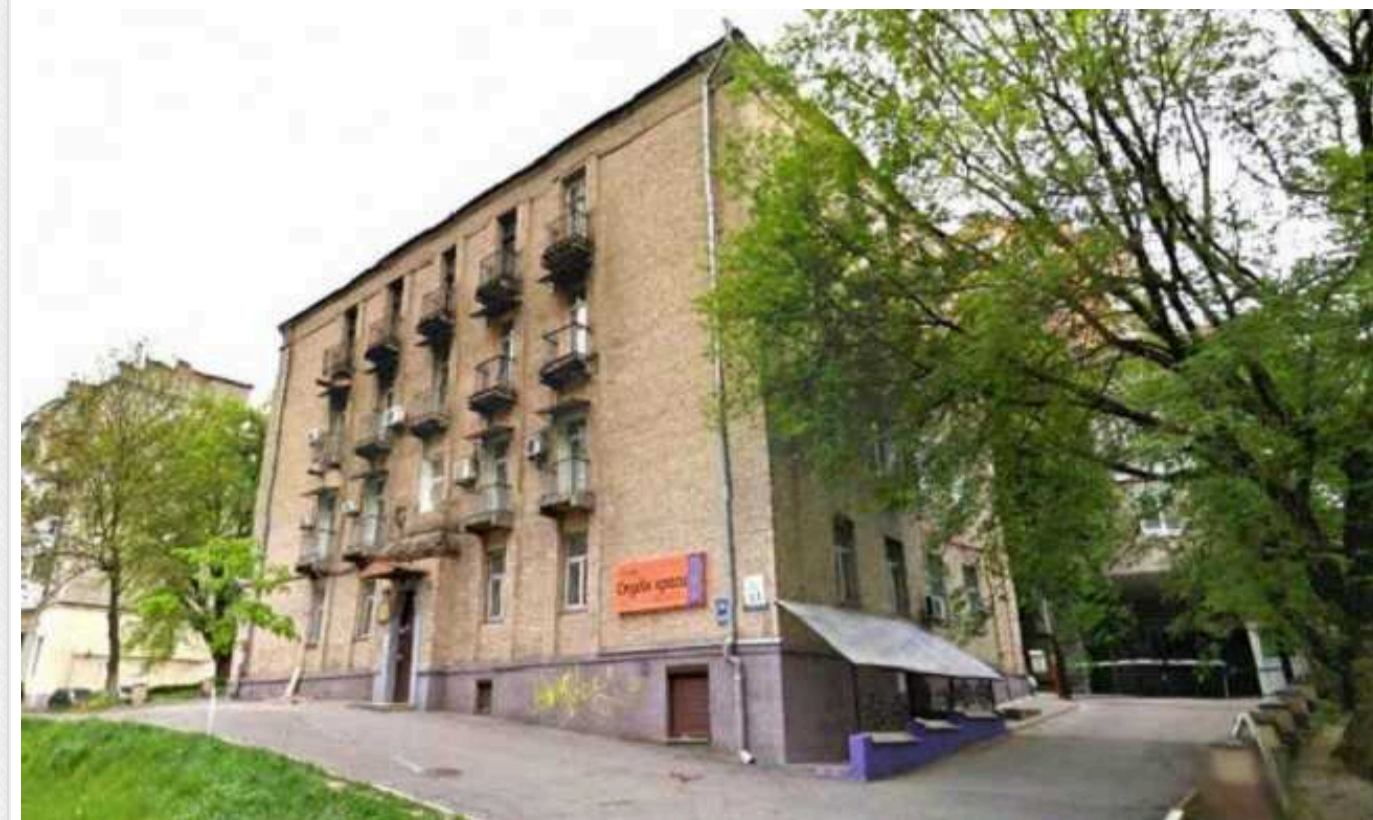
Голосіївська прокуратура через суд вимагає повернути державі приміщення вартістю понад 2,5 мільйона гривень