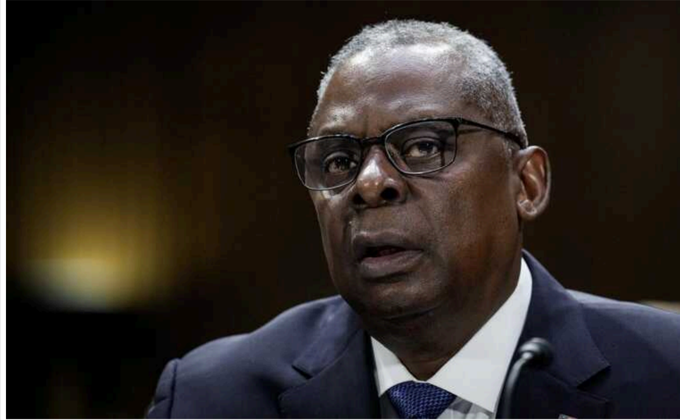
Ллойд Остін вважає, що "у якийсь момент" Україна вступить до НАТО

Республіканці поцікавилися у глави Пентагону в Сенаті, наскільки мета прийняття України до НАТО відповідає планам завершити війну.