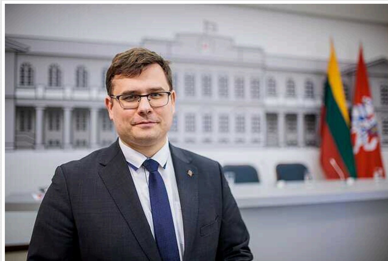
У Литві закликали не гаяти часу в боротьбі з військовою економікою Росії

Міністр оборони Литви Лаурінас Касюнас заявив, що члени НАТО повинні "готові якомога швидше" збільшити витрати на оборону щонайменше до 2% від валового внутрішнього продукту.