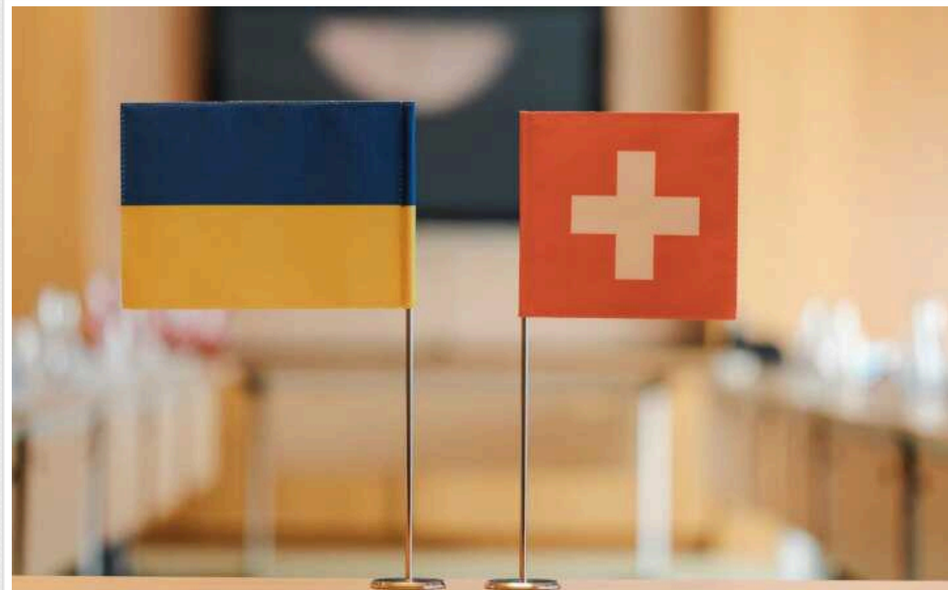
Швейцарія до 2036 року планує виділити на відновлення України 5 мільярдів євро

Швейцарія планує посилити економічний розвиток і довгострокову реконструкцію України протягом наступних дванадцяти років.