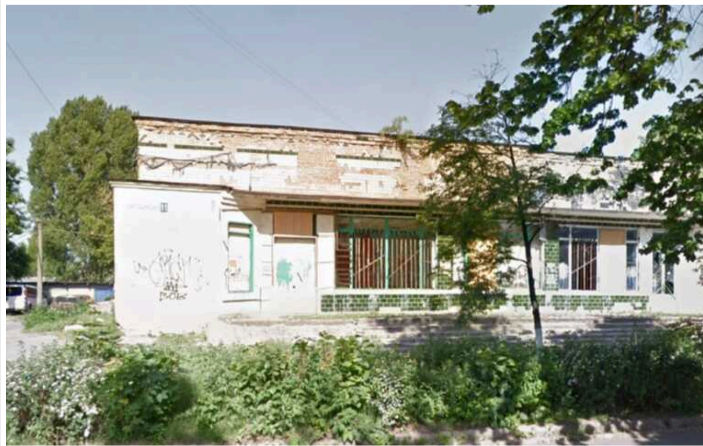
На Київщині знову намагаються злити 186 мільйонів на новий офіс мерії

КП «Головне управління комунального господарства» Вишневої міської ради Бучанського району Київської області 27 березня знову оголосило тендер на реконструкцію занедбаного кінотеатру під офіс мерії за 186 млн грн.