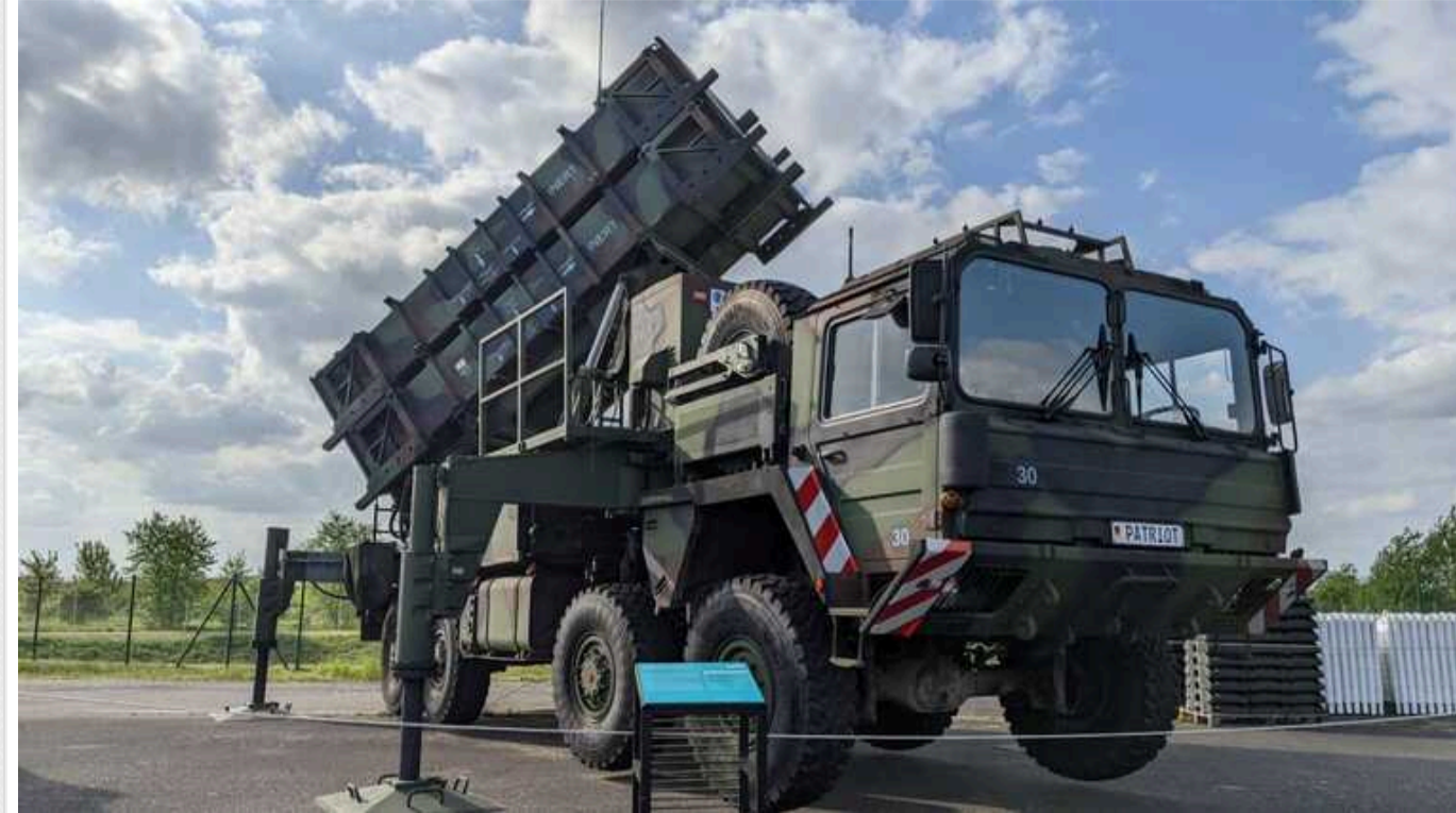
Боррель: Армії Євросоюзу мають близько 100 батарей Patriot, та все ще неспроможні надати 7 із них Україні

Високий представник ЄС Жозеп Боррель наголосив, що Європейський Союз має приділяти більше уваги не лише відновленню України, а й тому, як запобігти руйнуванню. Він підкреслив, що Євросоюз має надати країні більше засобів протиповітряної оборони, зокрема Patriot, які просила Україна, а також боеприпасів.