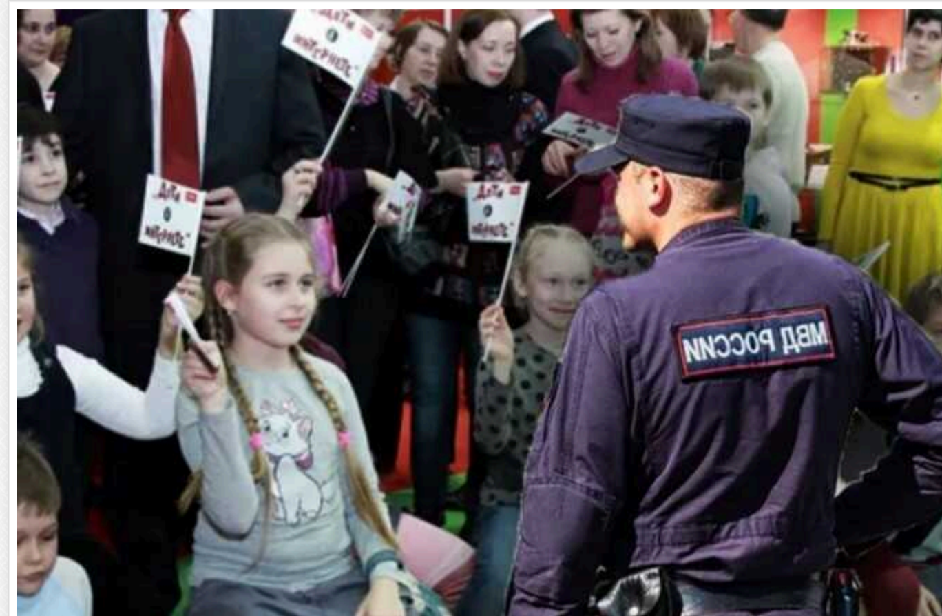
На захоплених територіях окупанти агітують сиріт з інтернатів служити на користь РФ, – ЦНС

Російські окупанти на захоплених територіях України влаштовують пропагандистські зустрічі в школах-інтернатах. Загарбники сподіваються "зліпити" із сиріт майбутніх поплічників.