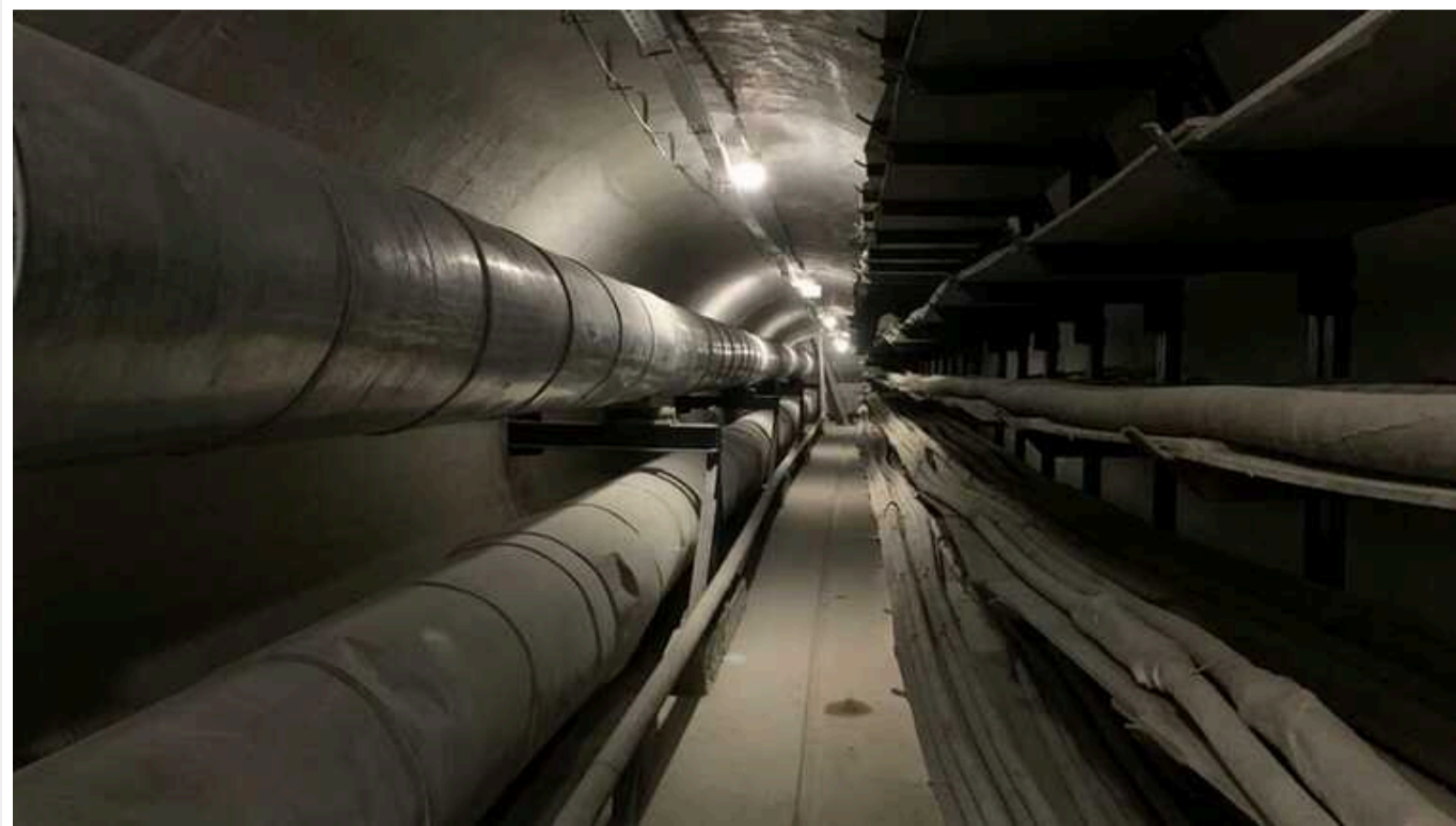
Каналізаційна тривога у Москві: українські хакери знищили IT-інфраструктуру «Москолектора» - джерело

Ця компанія відповідає за експлуатацію підземних водопровідних труб, кабелів зв'язку, силових кабелів та тепломереж столиці РФ.