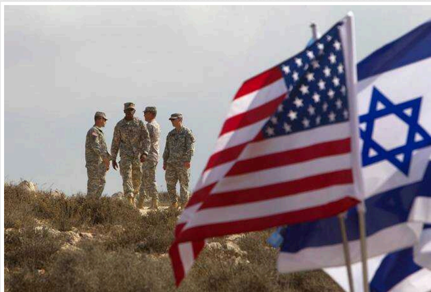
Сполучені Штати застерegli Ізраїль від операції в Рафаху після заяви Нетаньягу про дату штурму

Сполучені Штати продовжують виступати проти штурму ізраїльськими силами міста Рафах на півдні сектору Гази в межах операції, початої у відповідь на вторгнення терористів ХАМАС у жовтні 2023 року.