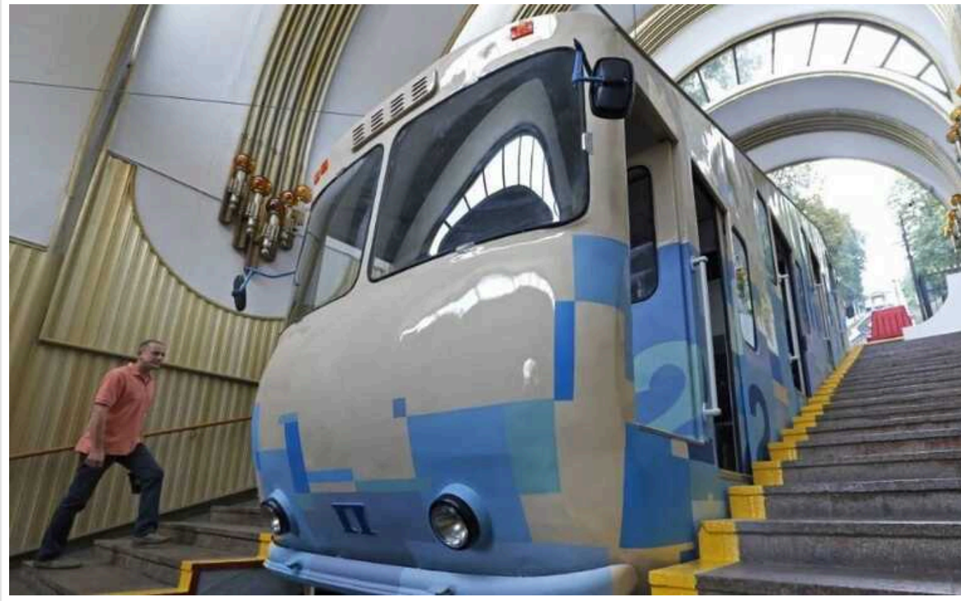
Працівнику УДО, який вбив підлітка на станції фунікулера, повідомили про підозру в умисному вбивстві

Правоохоронці повідомили про підозру військовослужбовцю, який був затриманий у зв'язку із загибеллю підлітка на станції фунікулера у Києві.