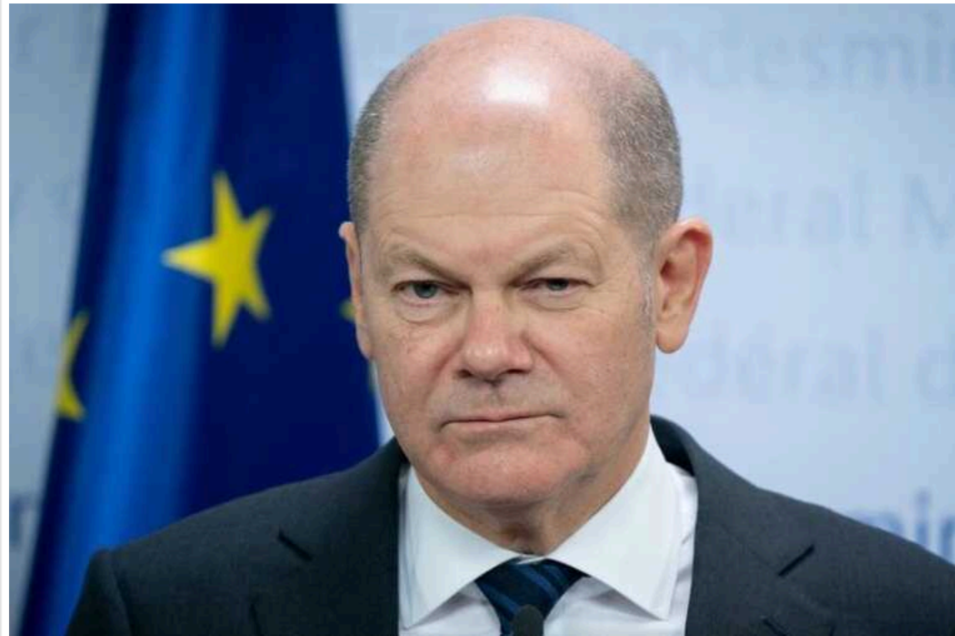
Шольц найближчим часом відвідає Китай: обговорить вплив Пекіна на РФ

Канцлер Німеччини Олаф Шольц вже цього тижня вирушить з візитом до Китаю. Він хоче обговорити з чиновниками КНР війну в Україні.