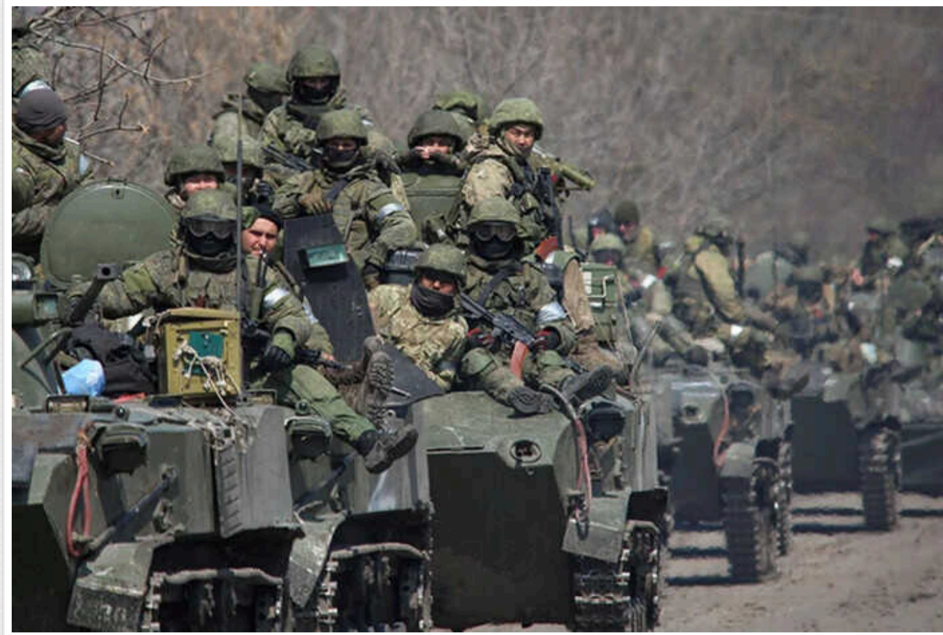
На один танк садять до 24 солдатів: у Росії закінчується бронетехніка, – BILD

Зазначається, що в окупантів залишилося не так багато бронетехніки для перевезення солдатів. Тому під час "м'ясних штурмів" на кожну машину всаджують максимальну кількість піхоти.