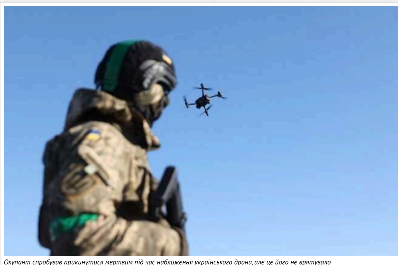
Окупант спробував прикинутися мертвим під час наближення українського дрона, але це його не врятувало

Російський загарбник, який вторгся в Україну, прикидався мертвим, щоб урятуватися від FPV-дрона наших захисників. Проте спектакль не вдался: "актор" різко вийшов із ролі й був знищений прицільною атакою.