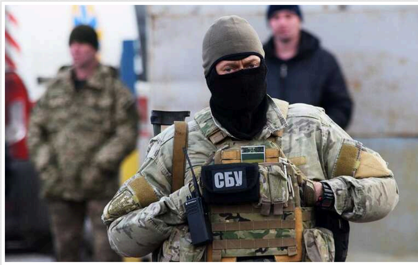
СБУ викрила на Полтавщині трьох прихильників Росії: захоплювалися Путіним

У Полтавській області Служба безпеки України викрила трьох любителів Росії, які захоплювалися диктатором Володимиром Путіним. Двоє жителів Полтави та одна мешканка Миргорода активно поширювали ворожу пропаганду через власні акаунти в заборонених соціальних мережах.