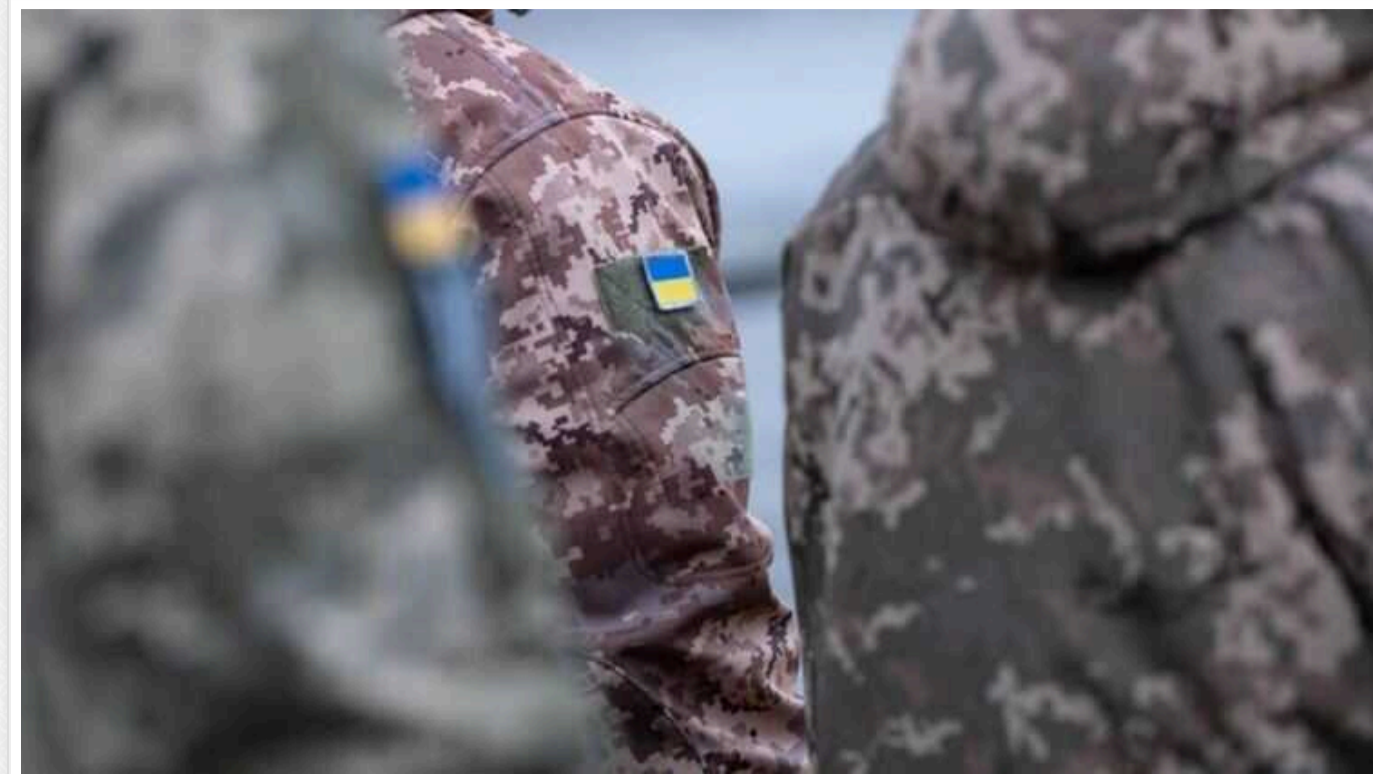
У Мінкульти зберегли бронь від мобілізації для працівників телемарафону

Це впливає із заяви Мінкульту, який підтвердив телеканалам, що беруть участь у телемарафоні, статус "критично важливих для функціонування економіки та забезпечення життєдіяльності населення у особливий період".