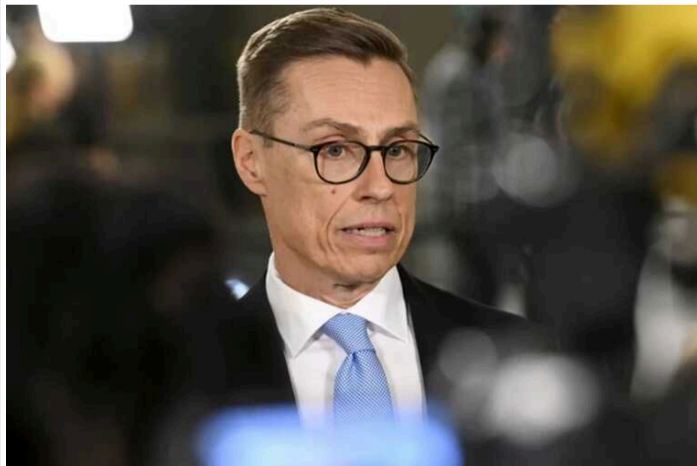
Президент Фінляндії про переговори України та РФ: єдиний спосіб досягти миру – це поле бою

Єдиний спосіб досягти миру в Україні – це поле бою. Бо диктатор Володимир Путін розуміє лише мову сили.