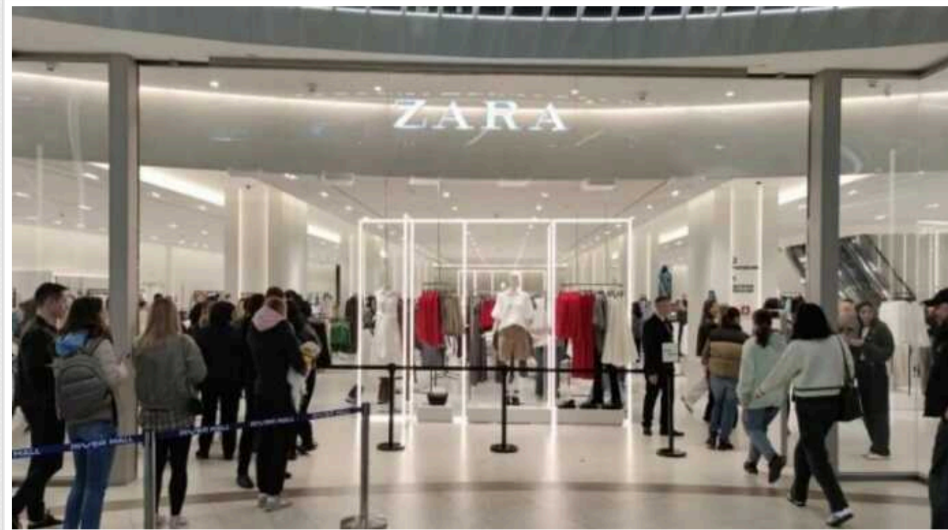
До нещодавно відкритих магазинів Bershka та Zara на вихідних юрмилися черги