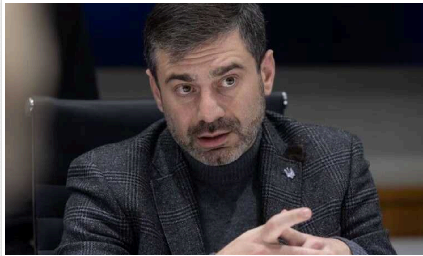
Розстріл військовополонених у Кринках: Лубинець звернувся до ООН і Червоного Хреста

Україна звернулася до ООН та Міжнародного комітету Червоного Хреста через розстріл російськими окупантами українських військовополонених.