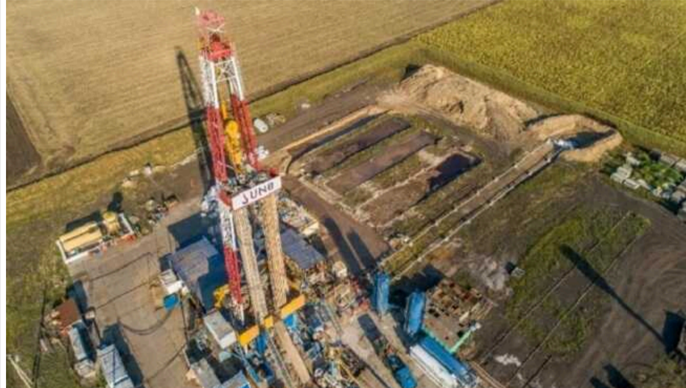
АРМА та «Укрнафта» просять РНБО втрутитися у ситуацію з видобутком газу

Агентство з розшуку та менеджменту активів (АРМА) і ПАТ «Укрнафта» звернулися до Ради національної безпеки та оборони із проханням вирішити питання щодо видобутку газу на Сахалінському родовищі.