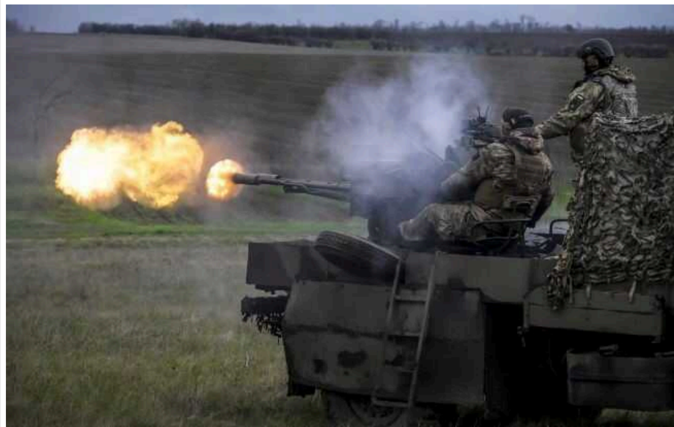
Сили оборони півдня упродовж доби ліквідували 162 окупанти та знищили 79 одиниць озброєння та військової техніки

Сили оборони півдня надалі завдають вогневого ураження по місцях дислокації ворога, вогневих позиціях і тилах.