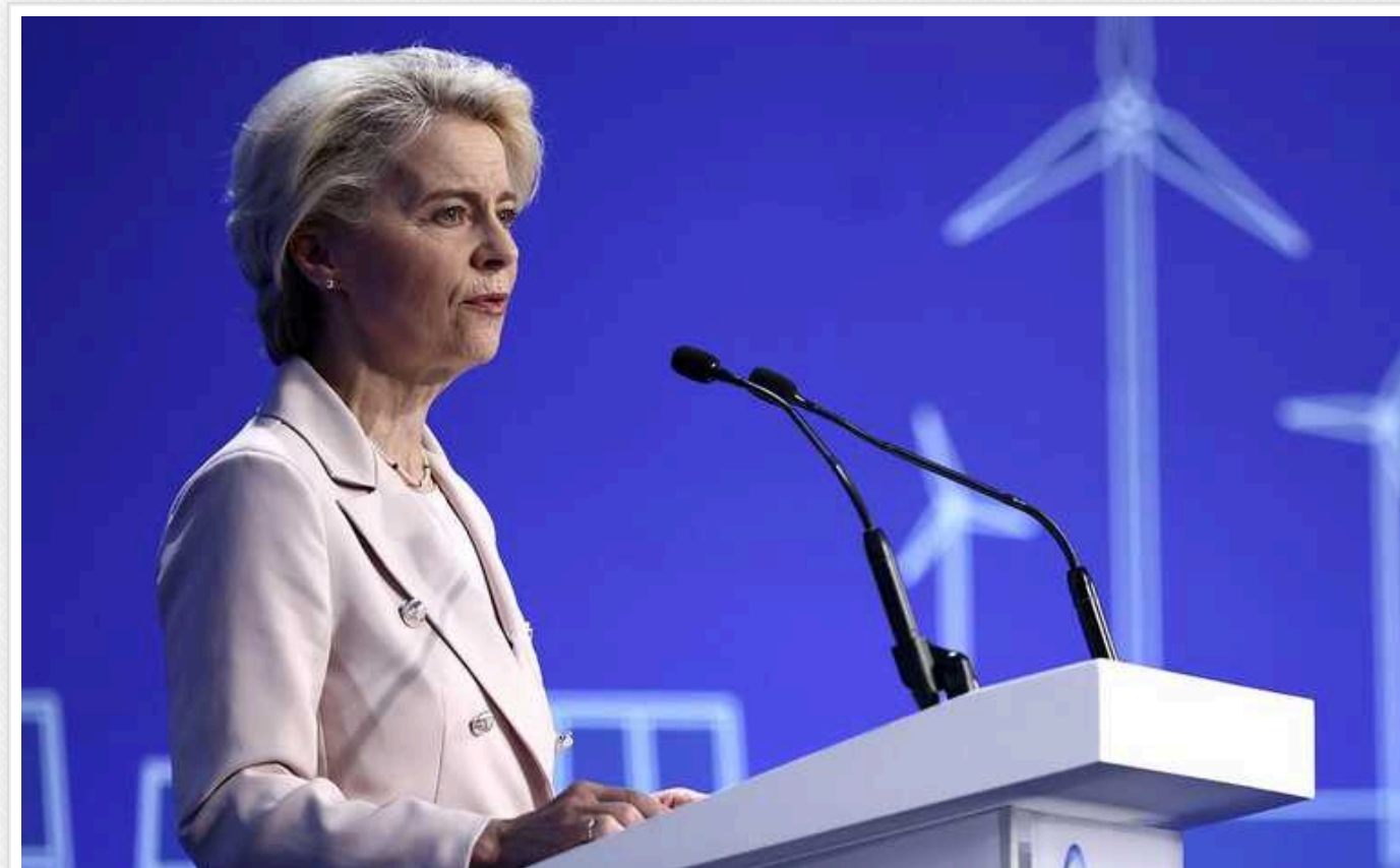
Урсула фон дер Ляєн розпочала свою кампанію на виборах до Європейського парламенту: пообіцяла дати відсіч "друзям Путіна"

Глава Єврокомісії Урсула фон дер Ляєн розпочала свою кампанію на виборах до Європейського парламенту. Виступаючи у Греції, вона пообіцяла дати відсіч прихильникам російського диктатора Володимира Путіна.