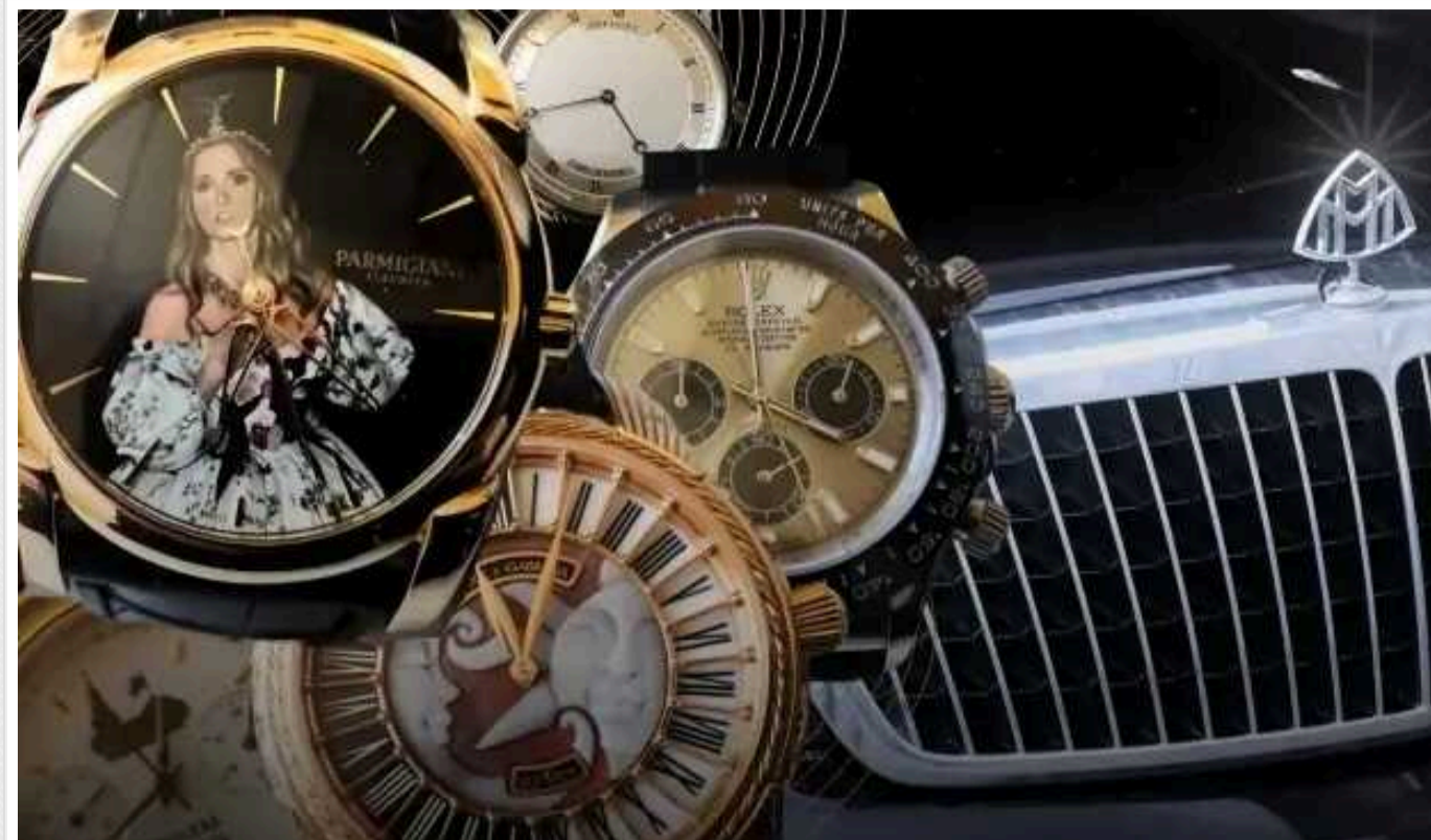
АРМА вирішило виставити на аукціон майно Медведчука: за скільки продадуть Maubach

Разом із елітним авто в АРМА планують продати ще й 20 наручних годинників.