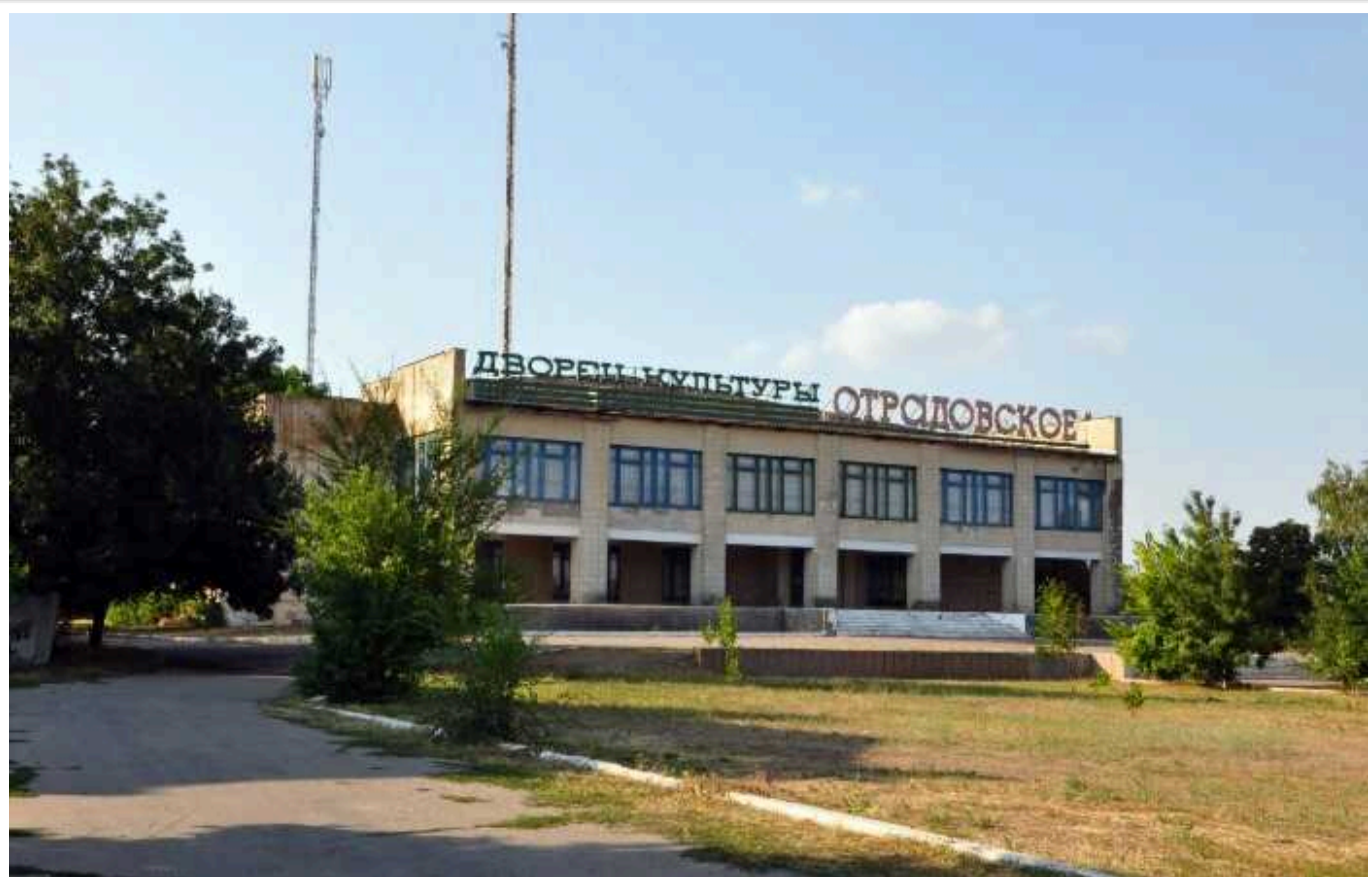
Звірства російських окупантів у Херсонській області. Катівня у Будинку культури села Одрадівка

У селі Одрадівка, розташованому у Генічеському районі Херсонської області, російські окупанти утримують незаконно затриманих мирних людей у підвалі Будинку культури.