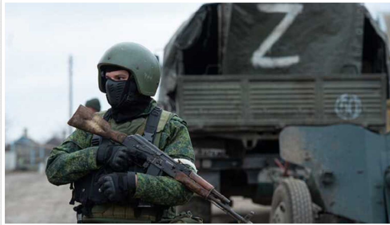
У мережі з'явилося відео чергової страти окупантами українських військовополонених

У районі н. п. Крички на лівобережжі Херсонщини росіяни розстріляли українських військовополонених.