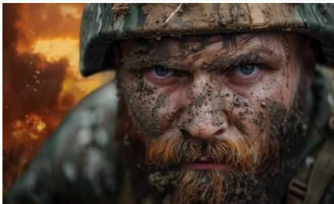
Героїчна 46-та ОАЕМБР: були в оточенні у Соледарі, билися за Бахмут і визволили десятки населених пунктів

46-та окрема аеромобільна бригада Десантно-штурмових військ. Свою бойову історію вони розпочали з контрнаступу на Херсонщині! Визволили від окупантів десятки населених пунктів та повернули туди прапори України.