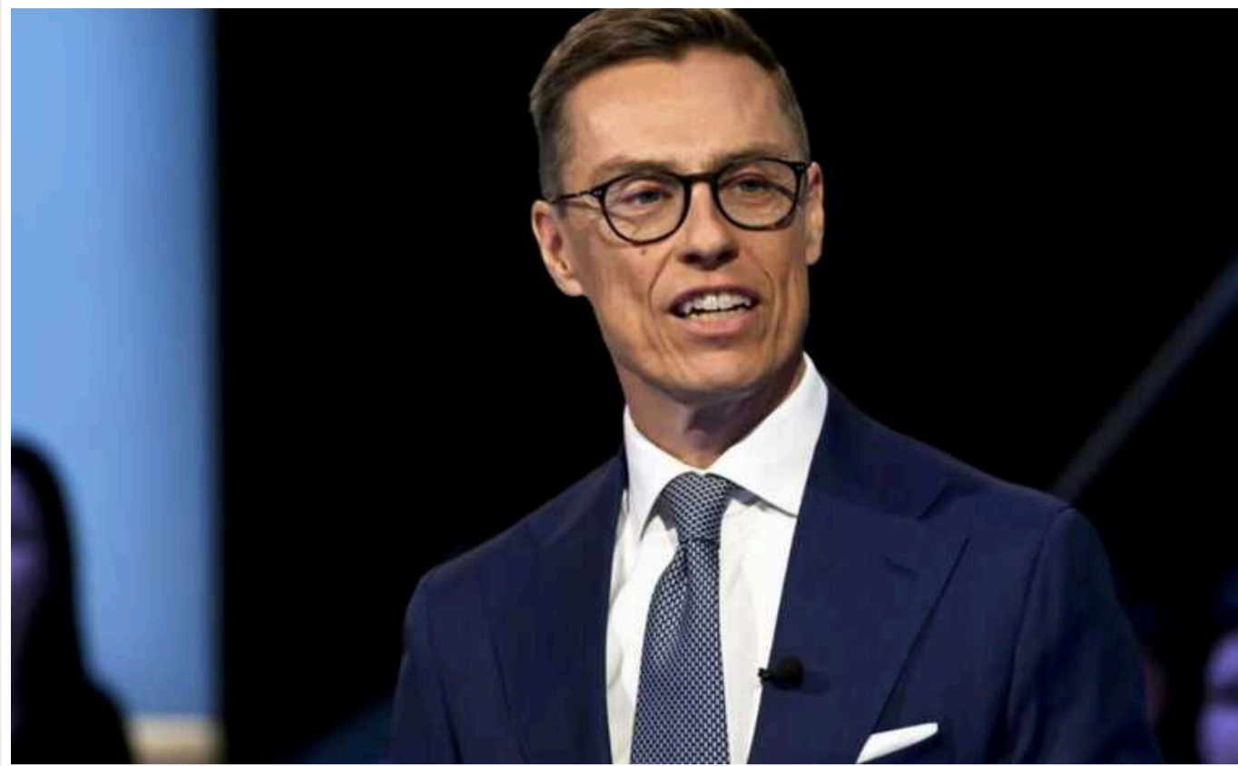
Президент Фінляндії вважає, що тримати закритим кордон з РФ – вірне рішення

Президент Фінляндії Александер Стубб вважає правильним рішення уряду тримати закритим кордон з Росією, адже воно допомогло запобігти ескаляції.