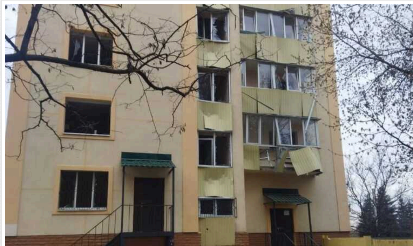
Атака на Харків: є влучання у приватний будинок